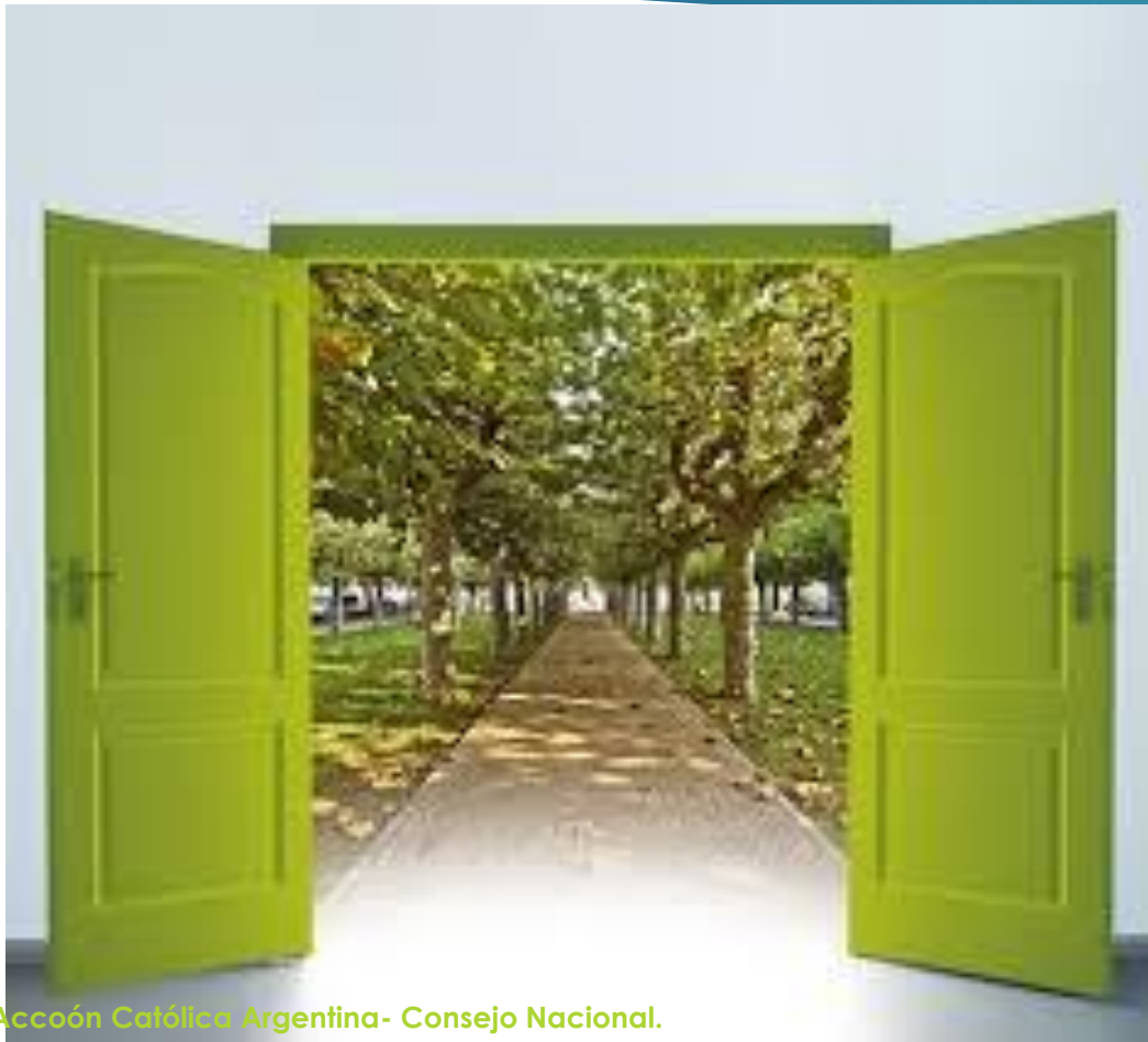
Acción Católica Argentina- Consejo Nacional.