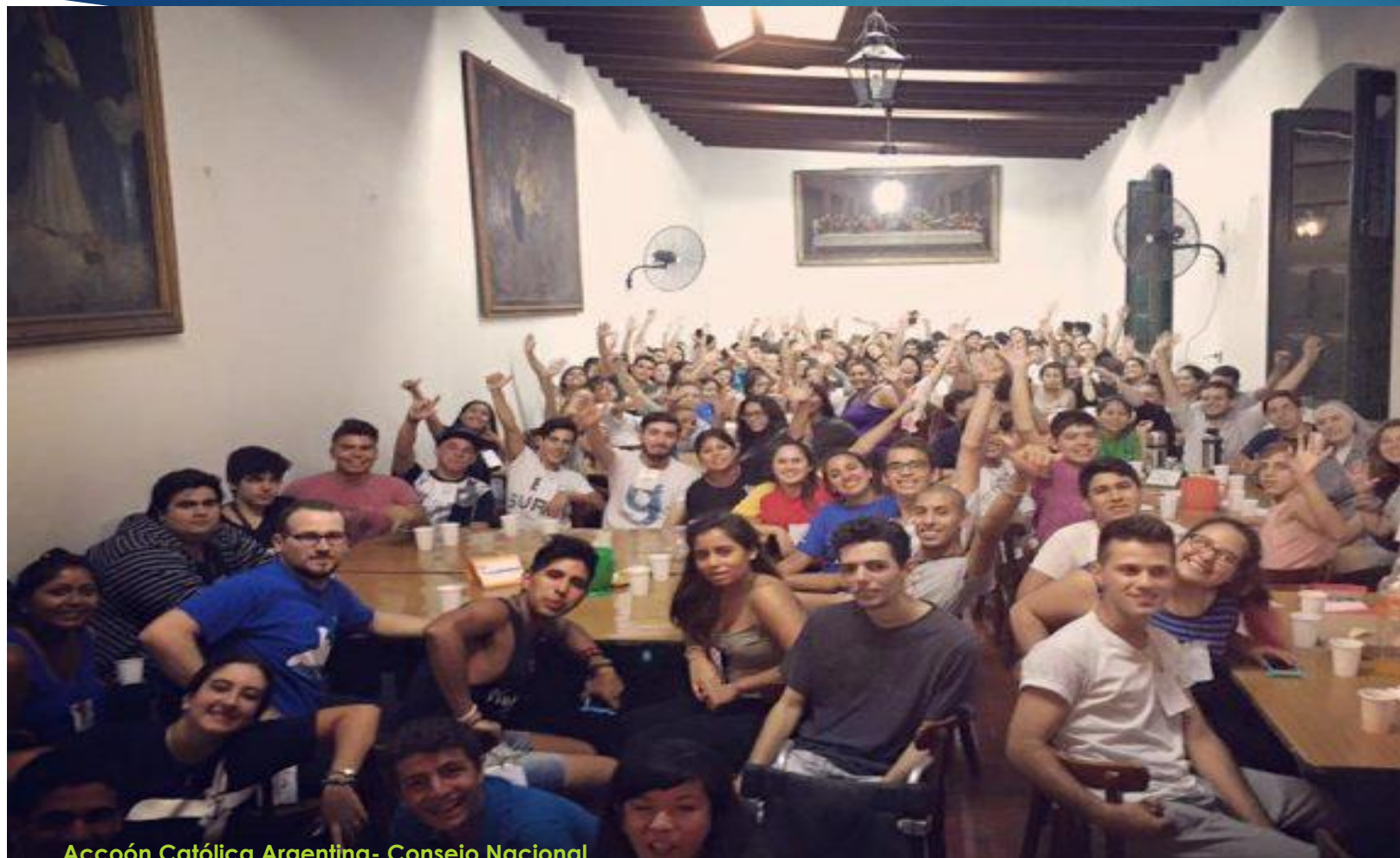
Acción Católica Argentina - Consejo Nacional.

Para poder seguir este camino es bueno recibir un baño de pueblo. Compartir la vida de la gente y aprender a descubrir por dónde van sus intereses y sus búsquedas, no importa del sector que sean... de todos los sectores sociales... por donde van sus intereses, sus búsquedas, cuáles son sus anhelos y heridas más profundas; y qué es lo que necesitan de nosotros. Esto es fundamental para no caer en la esterilidad de dar respuestas a preguntas que nadie se hace.